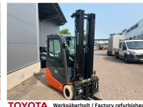
TOYOTA Werksüberholt / Factory refurbished