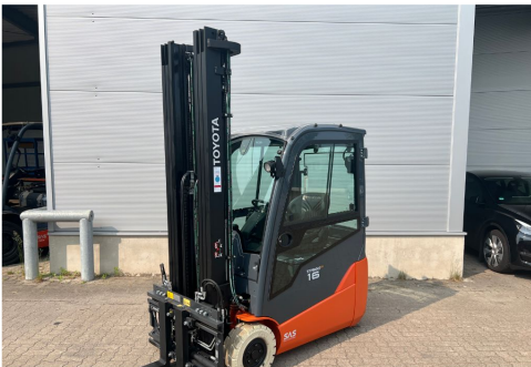
TOYOTA Werksüberholt / Factory refurbished

Es gelten unsere Verkaufs- und Lieferungsbedingungen.