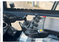
TOYOTA Werksüberholt / Factory refurbished

Preis: 17.900,00 € (zzgl. MwSt.) (Zwischenverkauf vorbehalten)