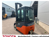
TOYOTA Werksüberholt / Factory refurbished