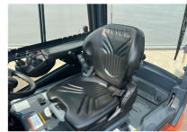
TOYOTA Werksüberholt / Factory refurbished